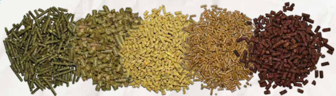
HEUCOBS 4 mm